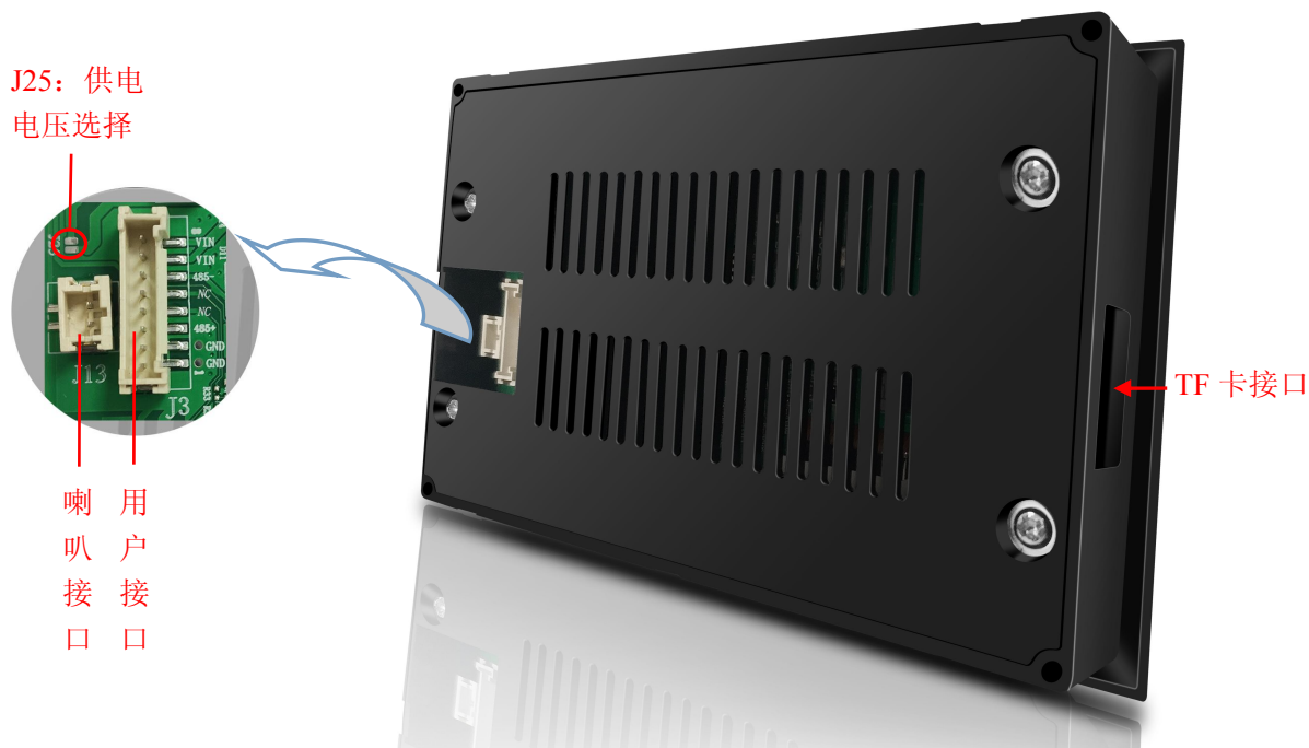
图 1 产品外观及硬件配置图